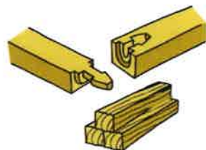
木材・木製品製造